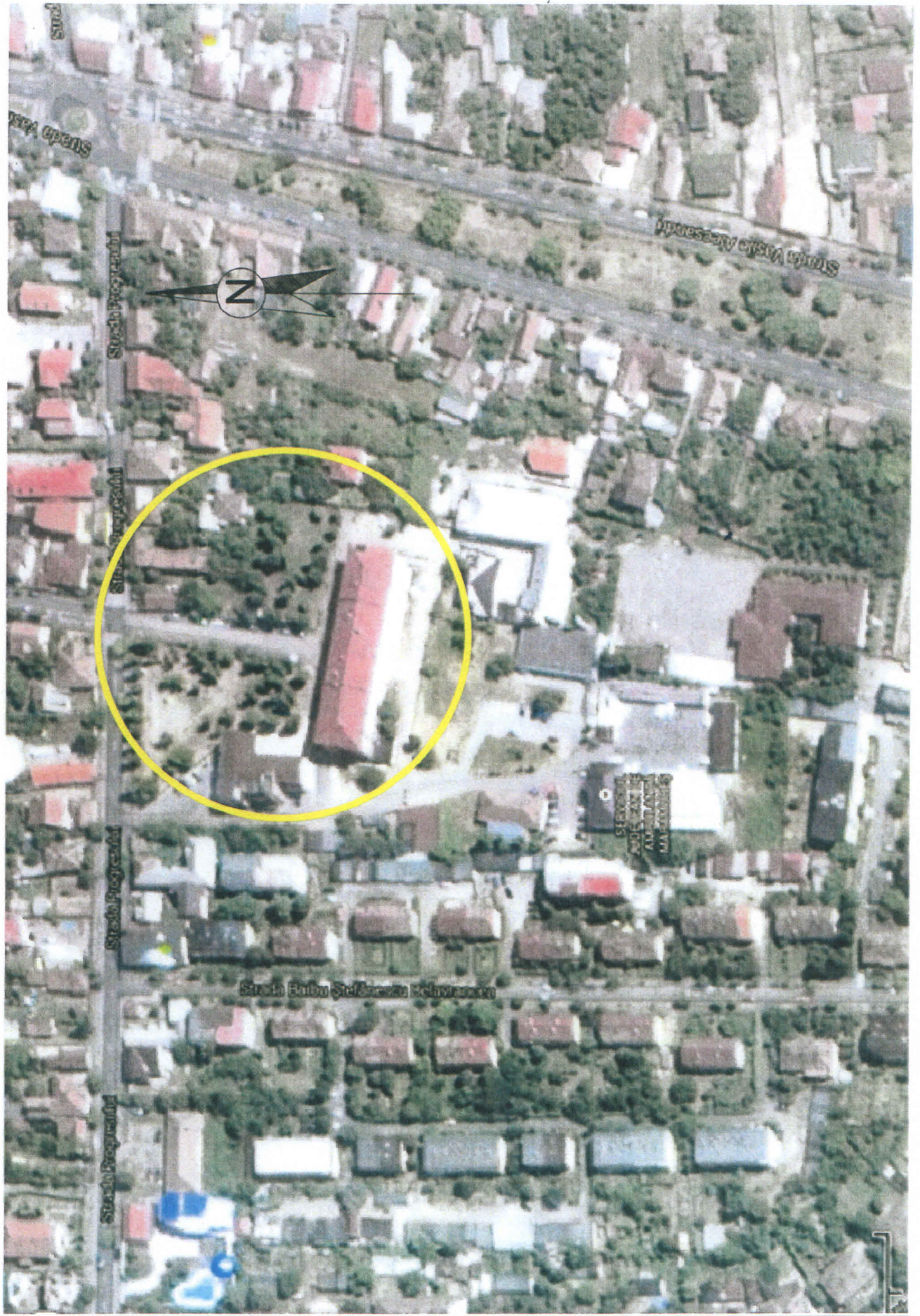
PLAN DE INCADRARE IN ZONA scara 1:2000